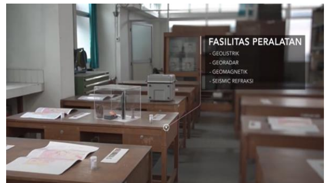
Laboratorium Geofisika Eksplorasi