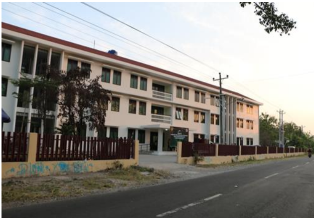
Laboratorium Stasiun Lapangan Geologi Prof. Soeroso Notohadiprawiro