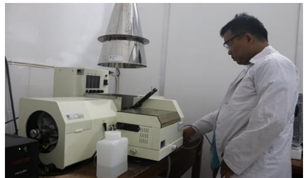
Laboratorium Pusat Geologi