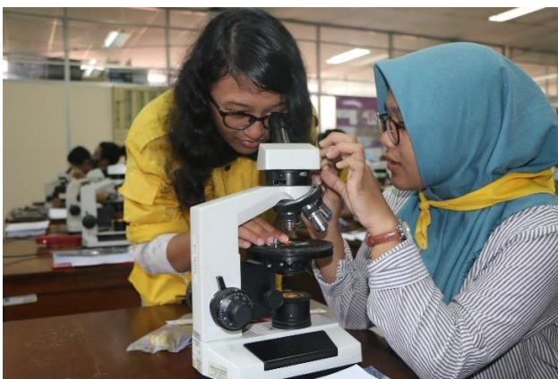
Laboratorium Geologi Optik