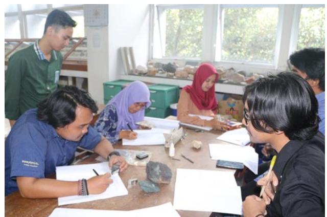
Laboratorium Bahan Galian