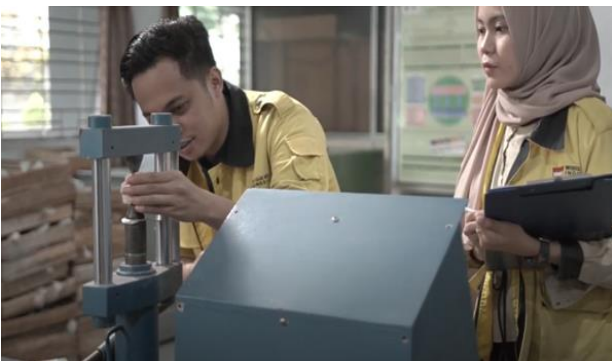
Laboratorium Geologi Tata Lingkungan (GTL)