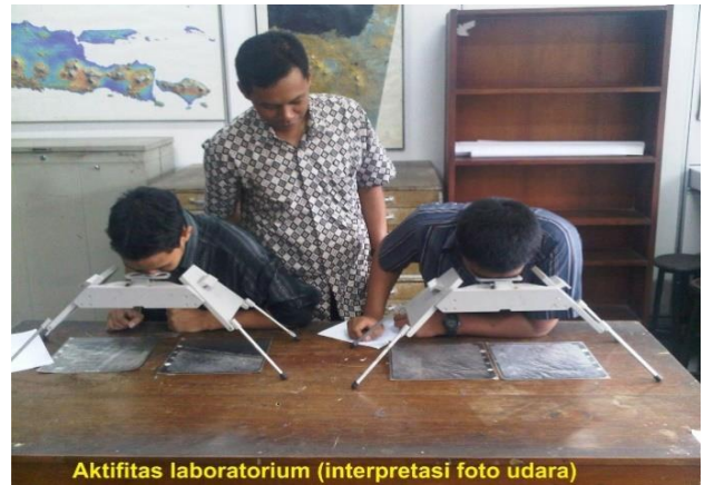
Laboratorium Geologi Dinamik