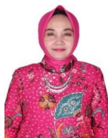
Prof. Ir. Dwikorita Karnawati, M.Sc., Ph.D. 196406061990032002 Profesor Geologi Teknik, Geologi Lingkungan

Ir. (Universitas Gadjah Mada) M.Sc. (Leeds University, England) Ph.D. (Leeds University, England)